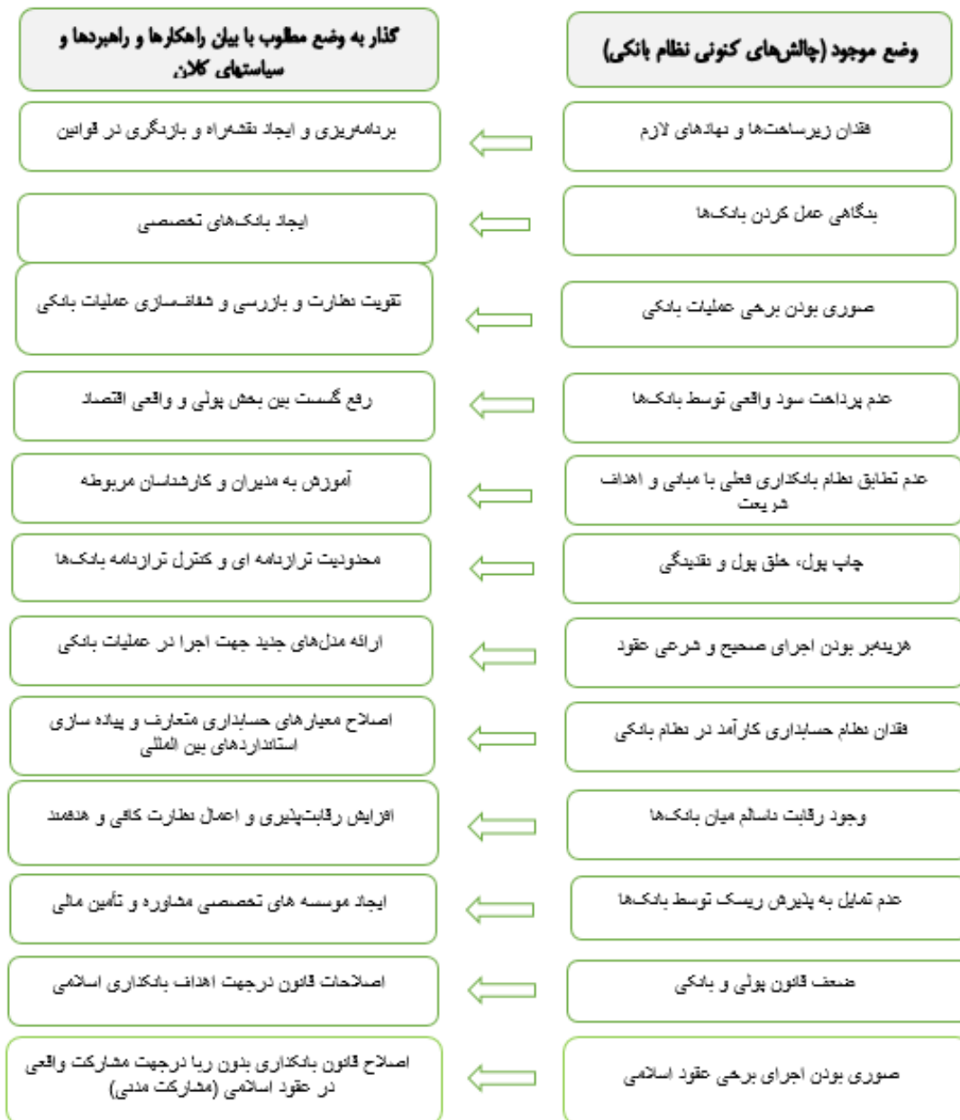
شکل ۲: مدل تکاملی گذار به بانکداری اسلامی در ایران