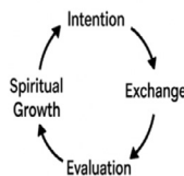
Quran-Inspired Social Exchange Model (QISEM)

بحث و نتیجه‌گیری: مدل QISEM فراتر از یک توصیه اخلاقی صرف، یک «سیستم خود-تنظیم‌گر» برای روان انسان در تعاملات اجتماعی ارائه می‌دهد. یافته‌های پژوهش تبیین می‌کند که این مدل از طریق سه تحول بنیادین، خلأهای نظری موجود را مرتفع می‌کند: نخست، تحول شناختی که طی آن