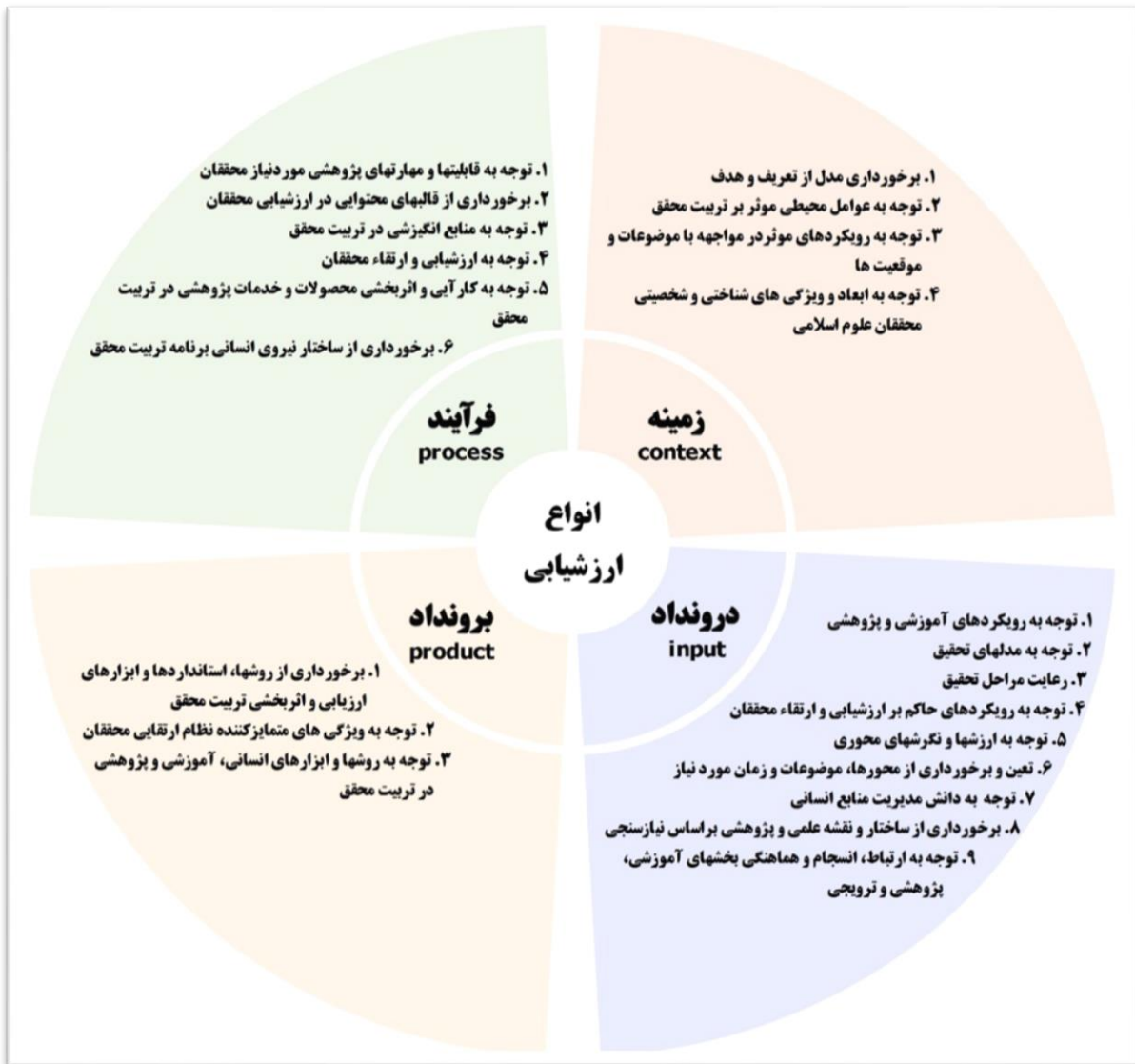
شکل شماره ۲: مضامین سازمان‌دهنده مدل‌های تربیت محقق علوم اسلامی براساس الگوی ارزشیابی سیپ (cipp)