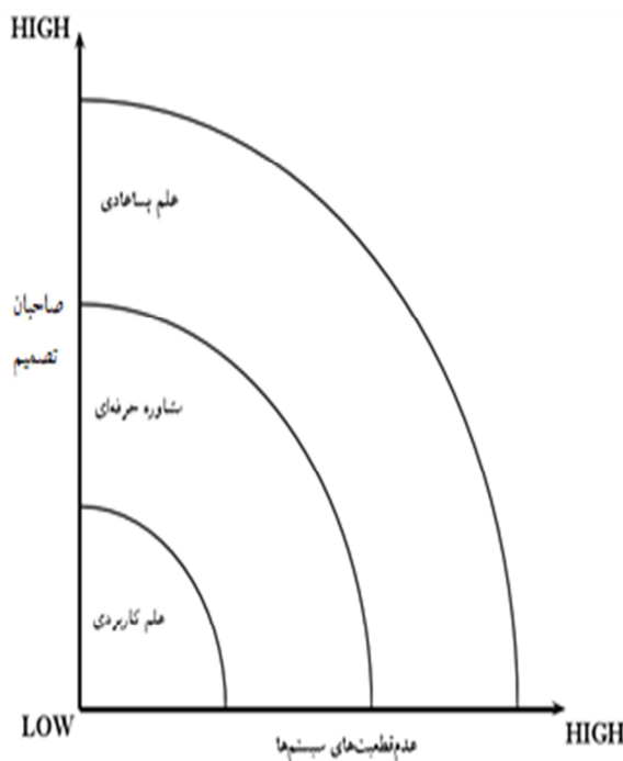
شکل ۲. نمودار سطوح متفاوت مسائل

علی‌الاصول بتوان آن را نوعی از مشارکت در بدنه بزرگ دانش قلمداد کرد، وظیفه مشاوره حرفه‌ای درگیر رفاه یا رضایت مشتری (یا افراد دیگری خارج از اجتماع هم‌تایان) است. دانشی نیز اگر در اینجا به دست آید از اهداف اصلی این نوع از فعالیت نیست (روتس و فوتوویکس، ۱۹۹۳b: ۹۶).