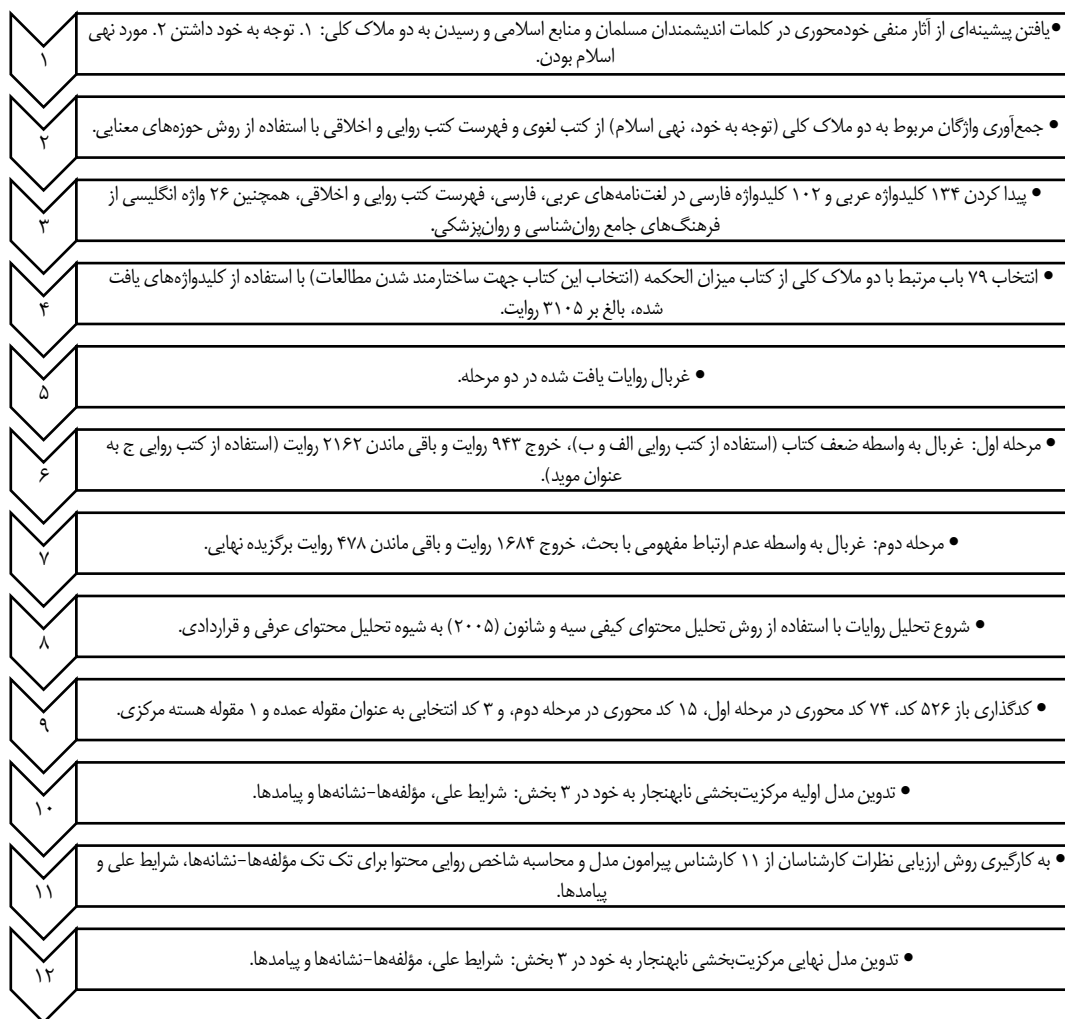
شکل ۲: چارت روند مراحل پژوهش