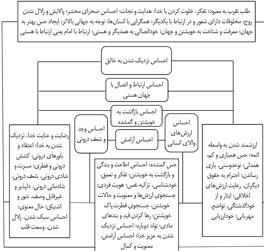
شکل ۲: چارچوب مفهومی حقیقت باطنی ادراک معنوی گردشگران ابرویداد مذهبی اربعین

ویژگی مهم رویدادهای مذهبی، تأکید بر اعتقادات و باورهاست. نتایج حاصل از مصاحبه با گردشگران نیز گویای این مطلب است، که باور و اعتقاد مذهبی عنصر کلیدی تشکیل‌دهنده چنین حرکت عظیمی در سطح جهان می‌باشد، به طوری که در هنگام توصیف و شرح حقیقت درونی، تمامی نکاتی که گردشگر در این ابرویداد مد نظر داشته است، در سیطره اعتقاد به حضرت سیدالشهدا علیه السلام و واقعه عاشورا می‌باشد. در ذیل توجه و اعتقاد به وجود امام، برترین بودن و سفیر بودن ایشان در جهان هستی، محوریت تمامی فعالیت‌های گردشگر در این ابرویداد رقم خورده است. گردشگر رضایت پروردگار، ارتباط با پروردگار هستی، نحوه حضور، و همه فعالیت‌هایش را با تحمل سختی‌هایی که در این ابرویداد با ویژگی‌های خاص آن مشهود است، همگی را در گرو ارادت، محبت و دوستی و حضور در این ابرویداد می‌بیند. این نگرش ماهیت و فطرت درونی گردشگر را شکل می‌دهد و در این بستر تمامی احوالات وی رقم می‌خورد. البته که کیفیت این