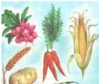
تصویر ۴: تصویرسازی درس چهارم