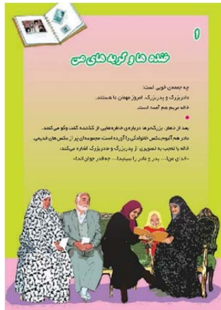
تصویر ۵: تصویرسازی درس اول کتاب دینی چهارم سال ۱۳۹۴