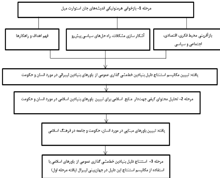
نمودار ۳- شمای کلی روش انجام تحقیق

هرمنوتیک اندیشه‌های میل آشکار کرد که نخست، دلیل بنیادین خط‌مشی‌گذاری عمومی یا اصول منفعت و ضرر، همان اهداف و وظایف اصلی حکومتند که به مثابه یک هنجار بنیادی در عرصه خط‌مشی‌گذاری به کار می‌روند؛ دوم، اهداف و وظایف حکومت از باورهای بنیادین در مورد انسان استنتاج شده‌اند. به تعبیر دیگر جان استوارت میل با پیش‌فرض‌های فایده‌گرایانه در مورد انسان و در شرایط اجتماعی، اقتصادی و سیاسی ویژه و با استفاده از راهکارها و استدلال‌های خاص آن شرایط، اهداف و وظایفی را برای حکومت تعریف کرد. اهدافی که از آن زمان تاکنون به مثابه یک اصل در تصمیم‌گیری عمومی به کار گرفته می‌شوند.