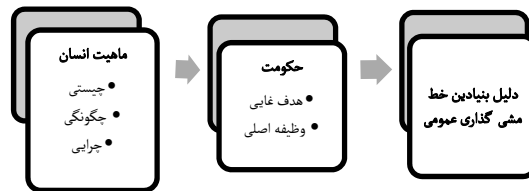
نمودار ۴- مکانیسم استنتاج دلیل بنیادین خط‌مشی‌گذاری عمومی از باورهای بنیادین

در فرهنگ لیبرال دلیل بنیادین خط‌مشی‌گذاری عمومی اصل منفعت است؛ زیرا مکتب فایده‌گرایی فرض می‌کند هدف غایی حکومت، تأمین رفاه، بهروزی و خوشبختی مردم است. این باور از آنجا ناشی می‌شود که در دیدگاه پیروان این مکتب، حکومت تجلی خواست اجتماع است و حکمرانی باید مطابق با خواست جامعه انجام شود. جامعه، متشکل از مجموعه افراد تشکیل‌دهنده آن بوده، منفعت یا خوشی آن، چیزی جز سرجمع منافع و خوشی تک‌تک اعضای آن نیست. هنگامی که هر فرد به هدف خود برسد، جامعه به هدف و خواست خود رسیده است. بنابراین، هدف حکومت، همان هدفی است که هر انسان در پی آن است.